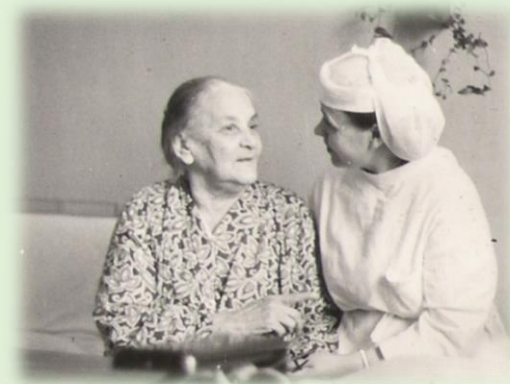
«Разговор по душам».