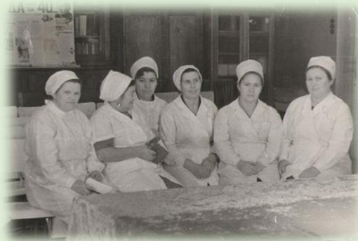
Совет старших сестер