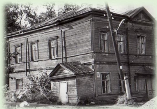
Одно из первых зданий больницы в г. Петрозаводск ул. Федосовой